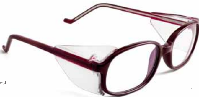
UG-4 unistyle BORDEAUX