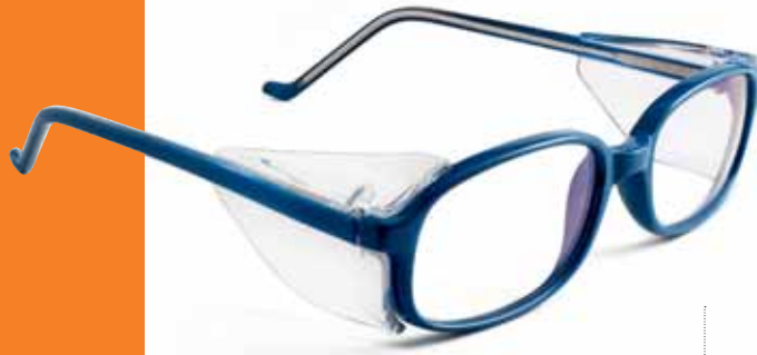
UG-4 unistyle BLUE

Detaillierte Produktbeschreibungen finden Sie auf unseren Datenblätter www.unicograber.com , EYEPREVENT