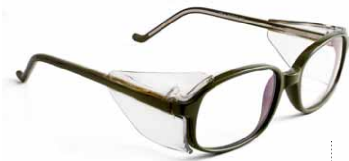
UG-4 unistyle OLIVE